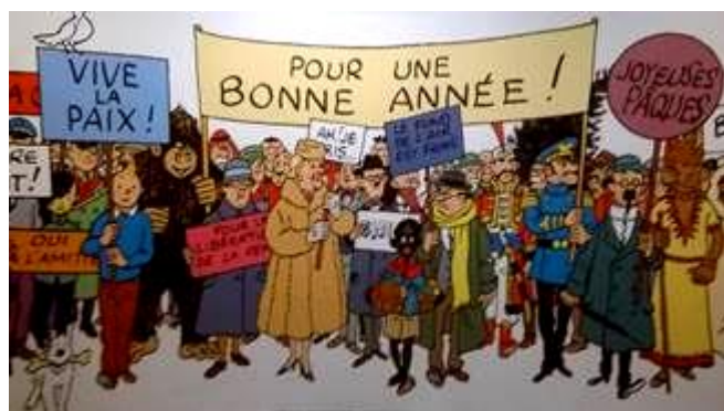
Souvenir de l'Expo Hergé visitée le 04 janvier 2017 avec le GEM

Voici la première Gazette de 2017. Meilleurs vœux pour cette nouvelle année !