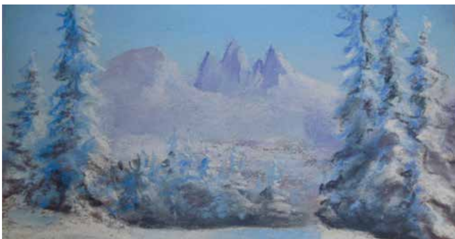
Un de ses premiers pastels - Photo Armelle

Nous avons un Atelier « Arts Plastiques » au GEM, j'y participe. Nos tableaux à l'acrylique sont régulièrement exposés. L'exposition de 2016 qui m'était entièrement consacrée, m'a permis de vendre deux tableaux à des salariés de la Fondation justement.