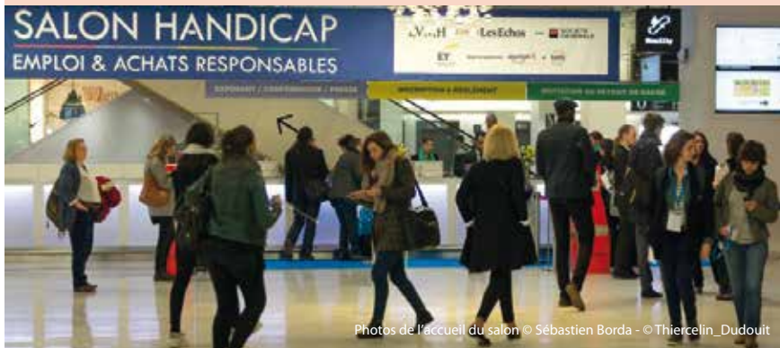
Photos de l'accueil du salon

Merci à tous les acheteurs, partenaires, RH de leur visite sur le stand et des échanges passionnants, challengeants et professionnels que nous avons eus.