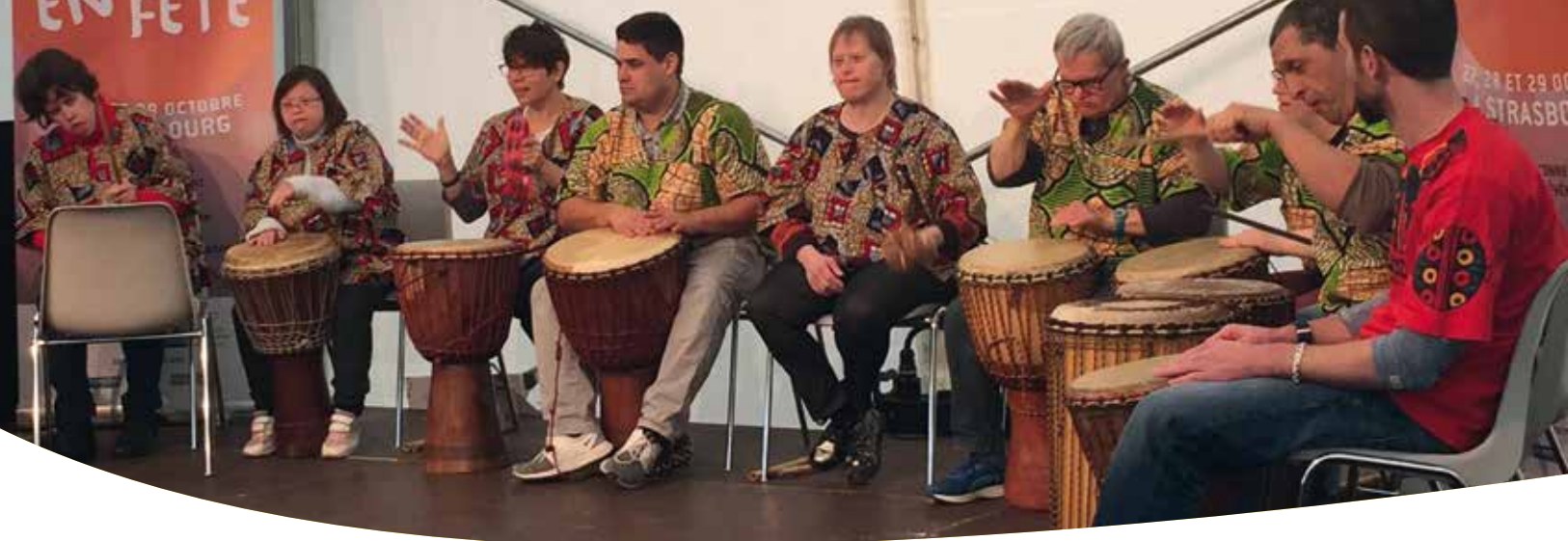
Un beau moment de partage grâce au spectacle de percussions proposé par les résidents du Foyer L'Alliance sur la scène centrale de l'événement Protestants en Fête 2017.