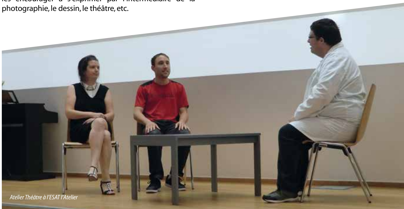
Atelier Théâtre à l'ESAT l'Atelier

Au-delà des performances artistiques, l'art invite parfois les personnes à se dépasser pour une représentation publique ou un concours par exemple. Ce fut le cas lors du Festival Court métrage « Triathlon de Montargis » pour lequel quatre résidents du Foyer du Domaine des Amis du Gâtinais ont écrit, filmer et monter un court-métrage de 6 à 8 minutes en 42 heures. Défi relevé avec brio puisqu'ils ont reçu le prix « Mention Spéciale du jury ». Tous ont été émus et heureux de se voir à l'écran et de recevoir une telle récompense. Une belle reconnaissance !