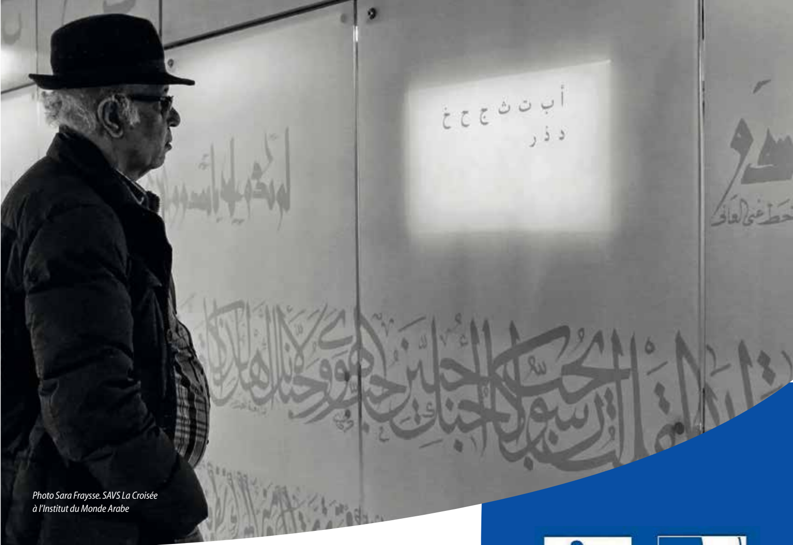
SAVS La Croisée à l'Institut du Monde Arabe

Pourtant, les efforts sont notables. Depuis 2001, une Commission « Culture et Handicap » a été créée afin de rassembler les différentes parties prenantes (ministères chargés de la Culture et des personnes en situation de handicap, établissements médico-sociaux, structures culturelles, associations de personnes handicapées, collectivités territoriales...) et réfléchir aux moyens d'améliorer l'accueil des personnes handicapées dans les lieux culturels mais aussi de leur faciliter l'accès aux pratiques artistiques. Depuis 2005 en France, la loi oblige les établissements accueillant du public (dont les lieux culturels) à se rendre accessibles pour tous, quel que soit le handicap.